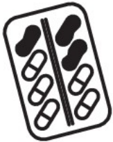
Comprimé, gélule, sachet poudre ou liquide